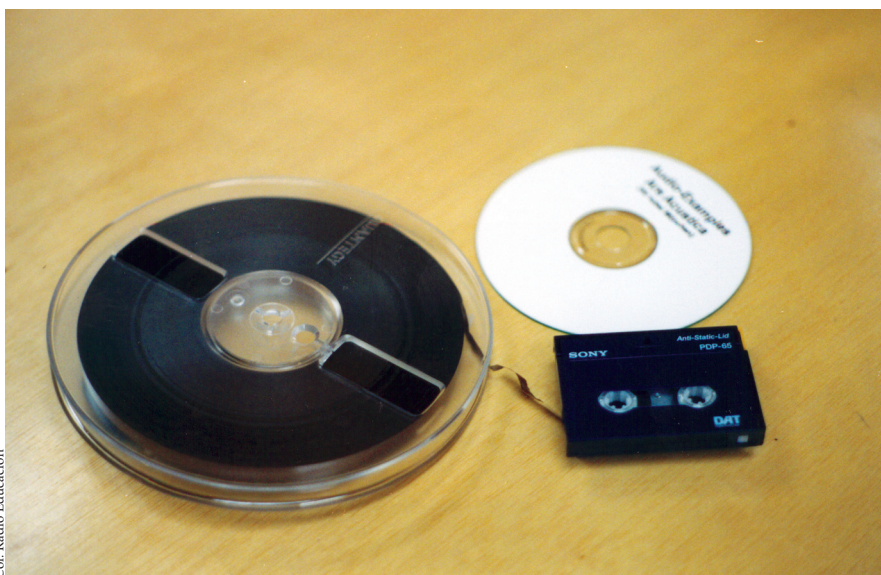
Col. Radio Educación

Asimismo, dicho Sistema en Radio Educación está concebido para que la fonoteca forme parte de la producción integral digital de la emisora, es decir que este recinto, que durante mucho tiempo fue el espacio para “almacenar las cintas” se erija, en el entorno de la producción digital, como el eje del proceso de producción radiofónica.