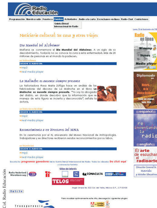
La página web de Radio Educación

Asimismo, debe anotarse que en Radio Educación se diseñó el primer servicio de información cultural en línea que recupera las principales noticias que día a día se transmiten en el noticiario cultural Su casa y otros viajes . Con ello, el acontecer cultural de México puede ser conocido en todo el mundo.