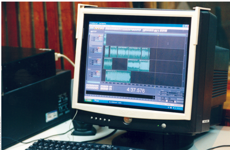
Col. Radio Educación

La radio participa de la redefinición como nuevo medio; confronta un cambio tecnológico fundamental, incluso “más importante aun que el que vivió con la incorporación de los transistores, la FM y la estereofonía”. 278 La transformación que vive el medio es resultado de la convergencia tecnológica que permite la digitalización, el almacenamiento digital, la hipertextualidad, la compresión de la señal y la automatización de los procesos de producción y transmisión. Asimismo, y a diferencia de los medios tradicionales, se abre un abanico de posibilidades de interacción, de diálogo y participación de la audiencia.