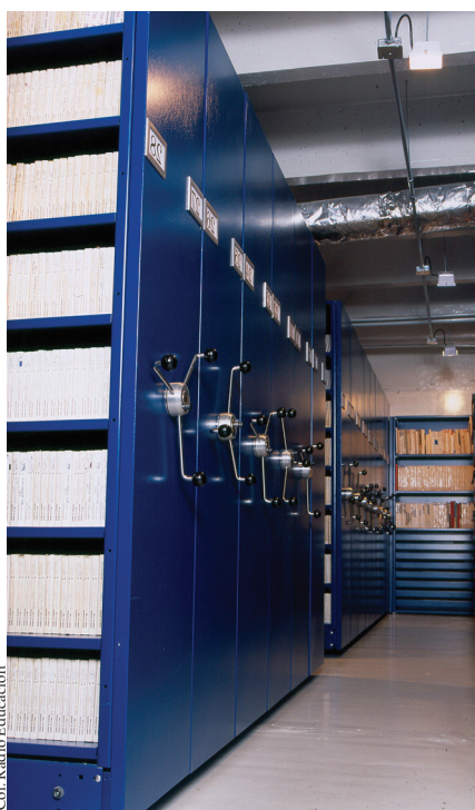
Col. Radio Educación

La remodelación de las áreas de trabajo de la fonoteca y la creación de bóvedas que permiten la conservación de los fonoregistros con que cuenta la emisora.